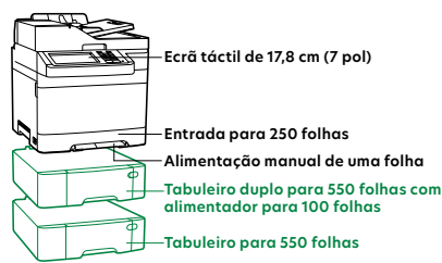
Ecrã táctil de 17,8 cm (7 pol)